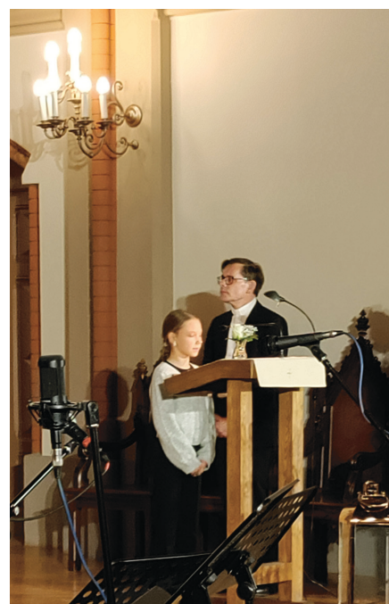
Mateja evaņģēlija 2. nodaļas lasījumu veic viens no jaunākajiem dievkalpojuma dalībniekiem.