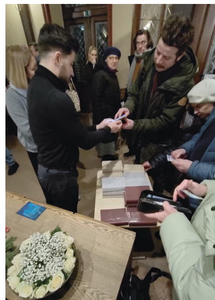
Pasākuma laikā pircēji varēja iegādāties jauno Bībeles izdevumu ar atlaidi.