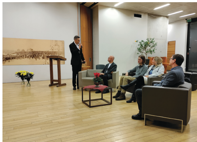
Paneldiskusija Torņakalna baznīcā par Jaunā tulkojuma revidētās versijas (2024) tapšanas darbu.