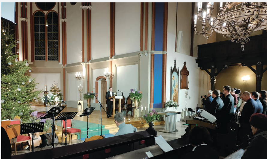
Bībeles Jaunā tulkojuma revidētā izdevuma atvēršanas pasākumu atklāj Torņakalna baznīcas mācītājs Linards Rozentāls.